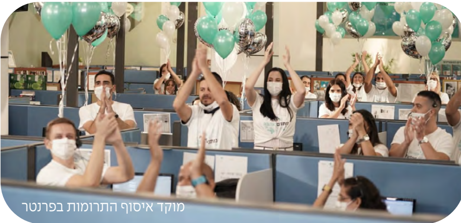
מוקד איסוף התרומות בפרנטר

במהלך המשדר הצלחנו לאסוף מעל 220,000 ארוחות חג עבור משפחות, קשישים וניצולי שואה נזקקים - שיא התרומות שגויס במהלך משדרי ההתרמה עד כה.