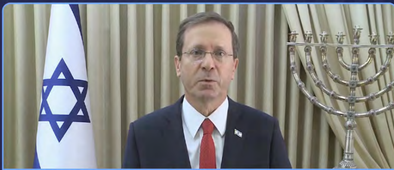
His Excellency Isaac Herzog President of the State of Israel